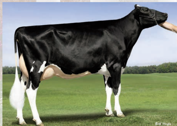
GENOSOURCE SABRE 35223