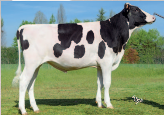
DGF W HANGON