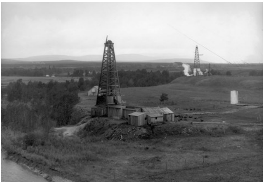
Albertai tájkép 1914-ből. Dingman 1-es és 2-es kút.