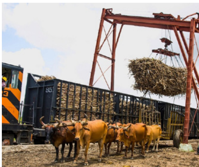
A cukornád betakarításakor még mindig használnak romana red ökrökkel vontatott kocsikat

A szelekció a vörös színre, a jó munkaképességre és a jó izmoltságra fókuszált. A tehének finom csontozatúak és kb. 500 kg-ot nyomnak. A bikák nehéz csontozatúak és átlagosan 900 kg súlyúak.