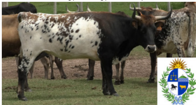
Criollo Uruguayo állomány és Uruguay címere

van helyi, a 17. században kitenyészített criollo (creole) marhafajta, ennek ellenére a szarvasmarha-állomány 80%-át az angus és hereford fajta adja. Teljesen fajtatiszta Criollo Uruguayo már csak alig pár száz maradt. Ezek is nagyrészt egy nemzeti park területén.