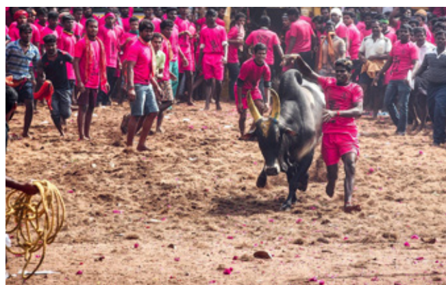
4. kép: Egy Véli virattu verseny pillanata

semmilyen más korlátozás és fizikai akadály nem állja útját az állat szabad mozgásának. A 7-9 fős csapatnak 30 perc áll rendelkezésére, hogy megszerezzék a bika szarvai közé kötözött jelképes batyut.