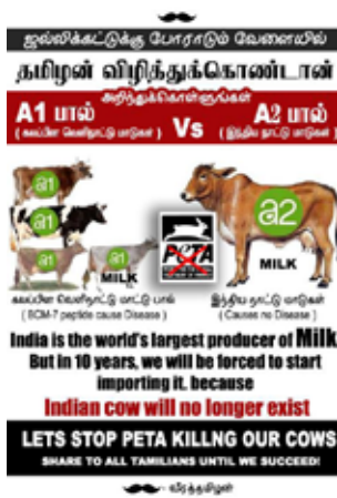
6-7. képek: A jallikattu mellett protestáló szervezetek (tenyésztők, sportolók stb.) mindenféle platformon népszerűsítik a hagyományos tamil fajtákat. Ebből kifolyólag változatos PETA és nyugati fajtaellenes plakátokat is találhatunk a már-már művészi megjelenésű támogató plakátok mellett. Külön érdekes a hazánkban is megjelent, lassan terjedő A2-es tejhez kapcsolódó kampány, amelyeknél az A2 tejtermelésre hivatkozva igyekeznek a hazai indiai fajtákat népszerűsíteni a potenciálisan A1 genetikával magasabb arányban rendelkező modernebb fajtákkal szemben.