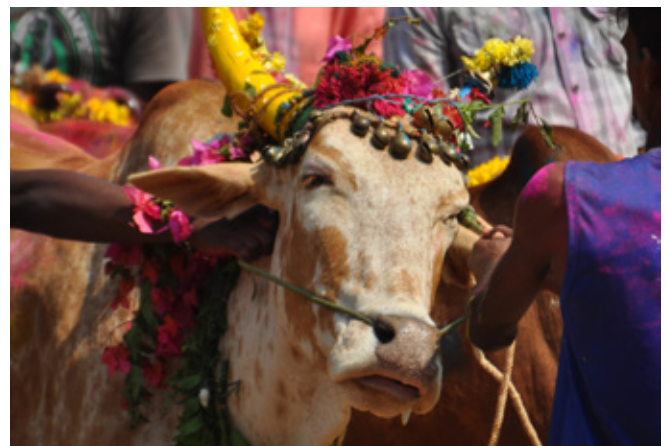
9. kép: Egy futamra feldíszített versenybika

A cikkhez felhasznált források a szerzőnél elérhetők.