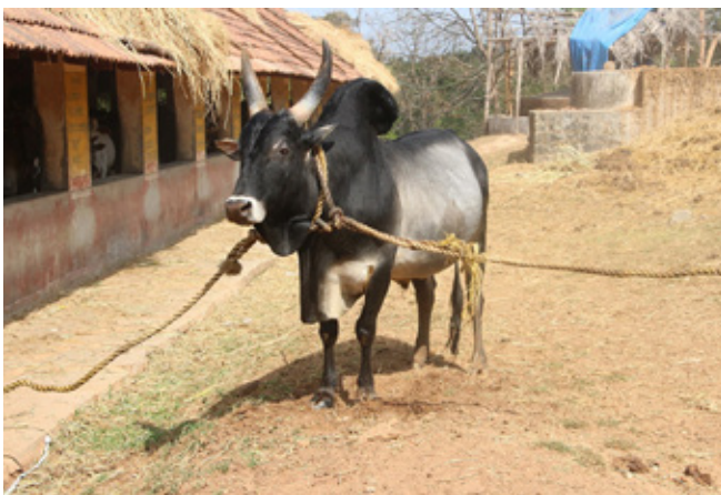
8. kép: Egy kangeyam bika

egyet jelent a hagyományos fajták megővésével is. Az állatokat külön trenírozzák a versenyekre. A versenybíráknak saját piaca van, ahol magas áron cserélnék gazdát az állatok. A versenyen az állatok egyedi virágdíszeket, csengőket és színes testfestést is kapnak.