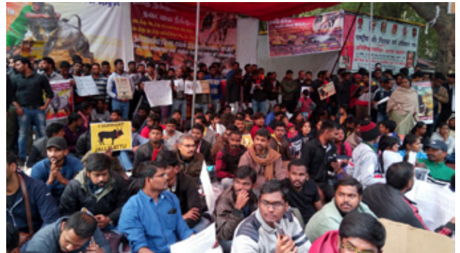
5. kép: A jallikattu mellett protestálók Új-Delhiben 2017 januárjában