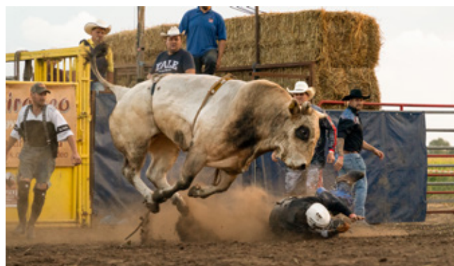
3. kép: A magyarországi rodeo egy pillanatképe a tavalyi Tyuxirodeóról.

zúzódások, húzódások és agyrázkódások az összes sérülés 42%-át, 16%-át, illetve 11%-át, míg a törések és elmozdulások csak az összes sérülés 5%-át tették ki. A sérülések 23%-a egy sportoló egyetlen menete során következett be. A sérülések 21%-a felszerelési hibának tulajdonítható.