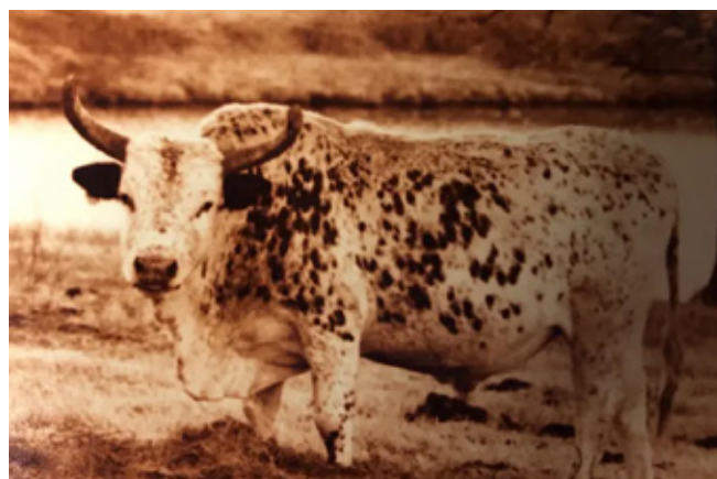
1. kép: Smokin Joe, egy Plummer vérvonalú (Original CP) bika, amely a Plummer munkásságát tovább éltető Danny McCoy tenyésztőnek alapjául is szolgált.

így a tenyésztő akkor tudja jól megítélni és válogatni a borjait, ha rendszeresen részt vesz versenyeken, és figyelemmel követi a bírók döntéseit és reakcióit az állatok értékelése közben.