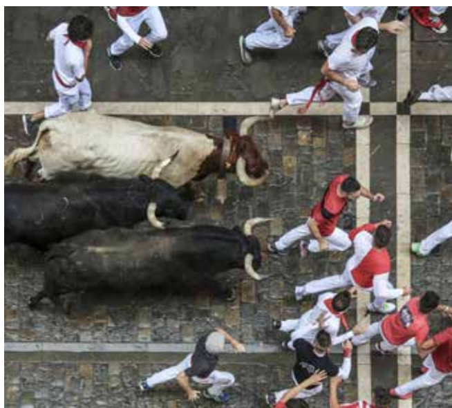
4. kép Szent Firminus fesztivál

A cikkhez felhasznált források a szerzőnél elérhetők.