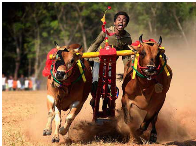
2-3. kép Fiatal versenyző a karapan sapi fogaton. Látható, hogy az állatok szeméit letakarják. Ezek a szemellenzők segítik az állatokat irányban tartani