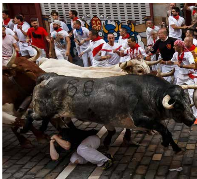
5. kép Jól elkaptott pillanat, amint a bikák átvágtatnak egy futó felett. César Manso (AFP) fotója (Forrás: www.arabnews.com ).