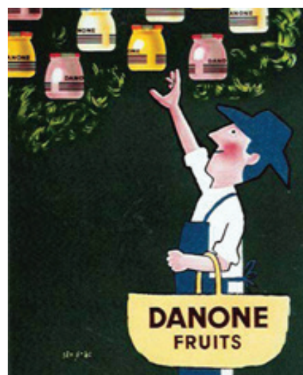
14. kép: 1960-ban így nézett ki egy Danone joghurtreklám Savignac elképzelése szerint (http2).

A fentiekén túl Savignac nagyon sokszor használt állatokat különböző termékek, színdarabok reklámjához (kutya,