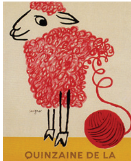
9. kép: Gyapjú témájú poszter 1951-ből (http10).