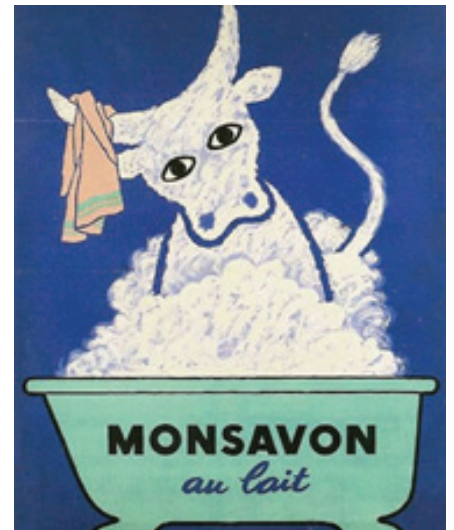
10. kép: Leghíresebb képének párja a Monsavon szappanhoz (1949) (http12).