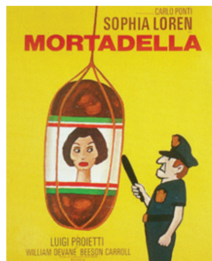
4. kép: Sophia Loren főszereplésével készült 1971-es vígjáték, a Mortadella plakátja ( http7 , http17 ).