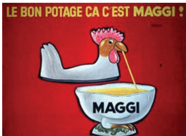
11. kép: Vintage tálaló edény a Maggi tyúkhúsleves plakátján. A félbevágott állatok egy finomabb változata (http13).