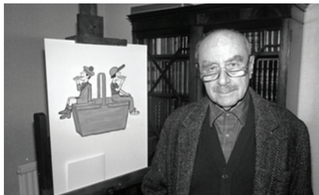
1. kép: Raymond Savignac ( http3 ).

A Monsavon siker után mintegy 20 évig tervezett plakátokat Párizstól New Yorkig olyan nagy cégeknek, mint az Air France, Bic (a jellegezetes logót is ő tervezte), Cinzano, Pepsi és a Dunlop ( http1-4 ).