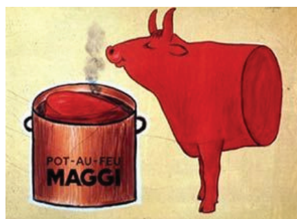
6. kép: Savignac 1959-ben készített posztere a Maggi instant marhahúsleveséhez ( http9 ).