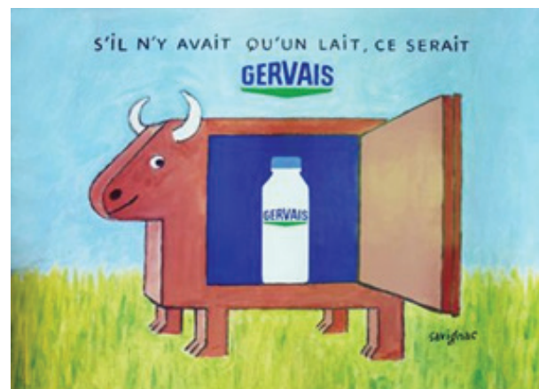
12. kép: A Gervais cég tejet hirdető 1993-as plakátja. Ez a cég 1966-ban egyesül a Danone-nal (http15).