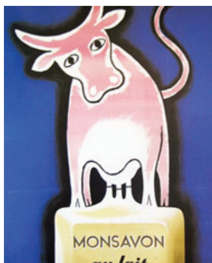
3. kép: Savignac első igazán sikeres plakátja ( http2 ).