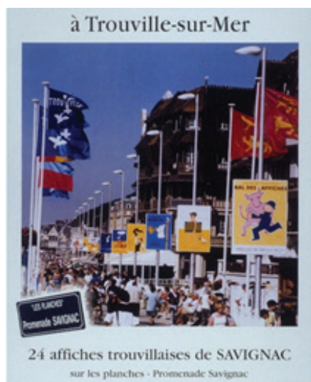
2. kép: Savignac posztereit és a sétányt reklámozó plakát 2001-ből ( http5 ).

Raymond Savignac 2002. október 30-án, 94 éves korában hunyt el.