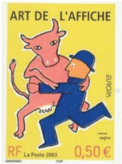
8. kép: A Francia Posta által 2003. május 12-én kiadott bélyeg. Mérete: 26x36 mm (http8).