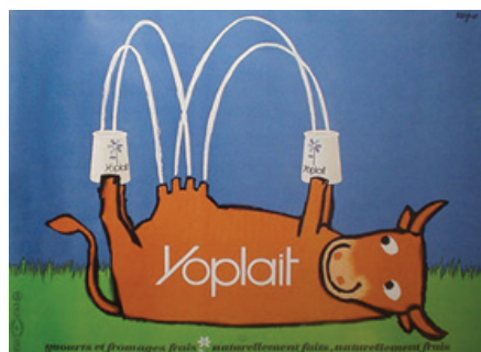
5. kép: A Yoplait joghurt gyár posztere 1967-ből. („Friss joghurtok és sajtok, természetesen készítve, természetesen frissek.”) ( http6 ).