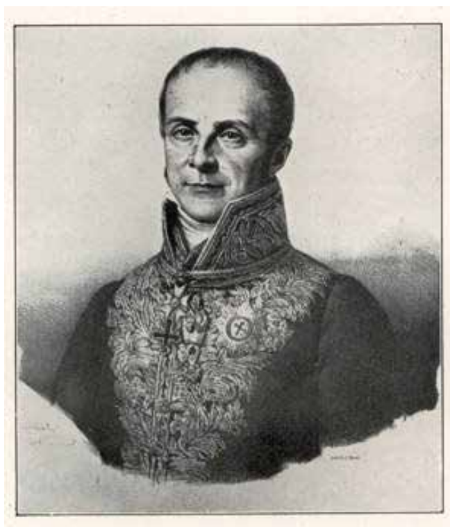
3. kép: Cristophe de Villeneuve-Bargemont portréja

1815-ben Cristophe de Villeneuve-Bargemont úr, a Lot-et-Garonne-i megye prefektusa, az Ageni Mezőgazdasági, Tudományos és Művészeti Társaság tagja, „Utazás a Barcelonnette-völgyben” című munkájában ezt írja: „a jumart gyakori ezen a vidéken, és nagyra értékelik, mert ötvözi az ökör erejét a szamár türelmével és józan természetével; éjszakára egy istállóba zárt bika és egy szamárkancá párosodásából születik.”