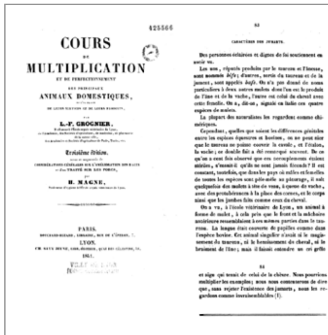
2. kép: Grogner 1841-ben megjelent művének borítója és a jumartokról szóló oldal.

Grogner a fent is említett, 1805-ös cikkében említést tesz egy kollégájáról, Claude-Julien Brendin-ről, aki szintén a lyoni Állatorvosi Iskola igazgatója is volt. Grogner azt írja, hogy Brendin Sospellóban, a Tengeri-Alpok területén szolgált a tüzérségnél, mint katonai állatorvos. Ekkor mutattak neki egy 3 láb 5 incs magasságú állatot, amely állítólag egy bikától és egy szamárkancától született. A testfelépítése a szamáréra, szőrzete viszont az öszvéréhez hasonlított; fara kerekesebb volt, mint egy szamárnak, gyomra pedig terjedelmes volt, mint a tehéneké. A nyaka rövid volt és vastag, a paták jól formáltak, osztatlanok. Míg a lábszárak (lábközépcsont, ágyúcsont) vékonyak, barázdánélküliek, addig a térdék viszont rendkívül nagyok voltak. A sörény fekete és bozontos volt, a fej nagy és jó állású, azonban a homlok hatalmas volt, középen erősen benyomódva, a szemek fölött hatalmas gumókkal, amelyek semmilyen nemű szarusodás nem volt megfigyelhető, amelyek a szarvakra utaltak volna. Az alsó állkapocsban a metszőfogak normálisan álltak, viszont a felső állkapocs metszőfogai hátrafelé mozdultak el, melyek közül a középsők jóval nagyobbak voltak, mint a mellettük lévők. A szemek hatalmas méretűek voltak, viszont az orr karcsú, mint a szamaraknál. Ez egy hím egyed volt, nemiszerve a szamarakéhoz volt hasonlatos.