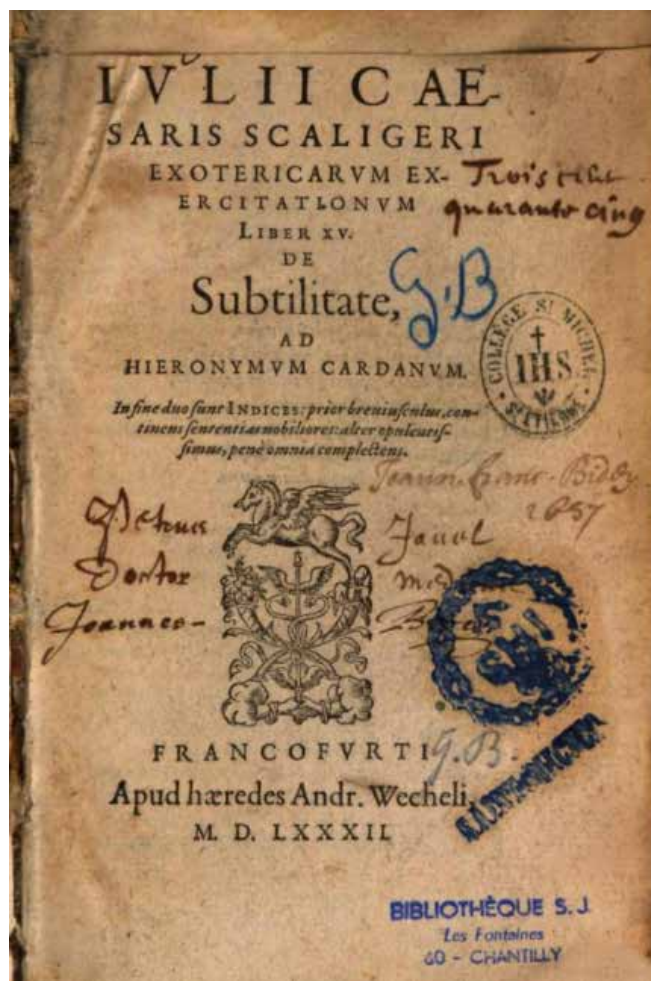
1. kép: Scaliger könyvének belső borítója (books.google.com)

Paul Zacchias X. Ince és VII. Sándor pápák magánorvosa 1651-ben megjelent híres publikációjában, a Quaestiones medico-legales -ben tesz említést egy jumartól, mégpedig a hibridekről szóló rész zárásaként: "Ez az egyed Borghesi bíboros tulajdona volt, amelyet ajándékba kapott Comitibus bíborostól, aki azt Franciaországból hozta, ahol ezeket tenyésztik. Feje, mint a tehéné, teste viszont inkább az öszvér tulajdonságaival bír, kivéve a lábait, mert azok tehénszerűek voltak, viszont a patái a lovakra emlékeztettek. A fogai mindkét állkapocsban torzak voltak, ezért nehezebbé esett a táplálkozás. Bár mindezek ellenére 32 évig élt."