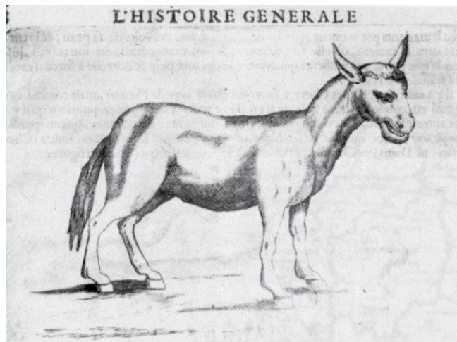
2. kép: Léger rajza a jumartról

völgyében található keverékállatokról, amelyek neve „Baf”, ha bika és lókanca, „Bif”, ha bika és szamárganca keresztezéséből származnak. A doktor azt is leírja, hogy ezek az állatok sarvvtalanok, öszvérméretűek és nagyon gyorsak.