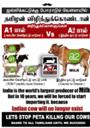
6-7. képek: A jallikattu mellett protestáló szervezetek (tenyésztők, sportolók stb.) mindenféle platformon népszerűsítik a hagyományos tamil fajtákat. Ebből kifolyólag változatos PETA és nyugati fajtaellenes plakátokat is találhatunk a már-már művészi megjelenésű támogató plakátok mellett. Külön érdekes a hazánkban is megjelent, lassan terjedő A2-es tejhez kapcsolódó kampány, amelyeknél az A2 tejtermelésre hivatkozva igyekeznek a hazai indiai fajtákat népszerűsíteni a potenciálisan A1 genetikával magasabb arányban rendelkező modernebb fajtákkal szemben.