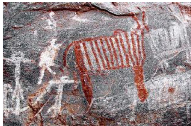
1. kép: A Tamilnádu állam területén található Kotagiri hegyi állomáson felfedezett sziklarajz, amelyet Kr. e 2000-1500 közé kelteztek.

megfelelően vannak kutatók, akik 4000 éves múltra vezetnek vissza a jallikattut. A híres tamil eposzban a Silappatikaramban, de más tamil irodalmi művekben is tesznek említést olyan személyekről, akik résztvevői vagy éppen nézői ilyen jallikattu versenyeknek.