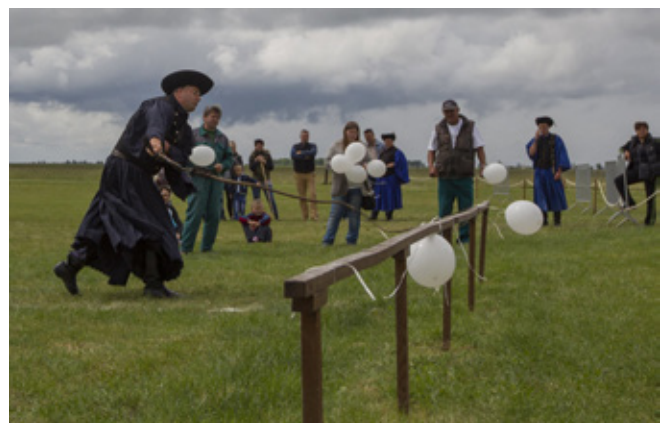
10. kép: A karikáshasználat pillanatképe

A versenyzők 5 szál virágot (vagy lufit) céloznak meg az ostorral. Egy célra legfeljebb háromszor csaphatnak. Egy csapással csak egy célt szabad eltalálni. Egyszerre két versenyző indul, az a győztes, aki hamarabb végez. Minden leszakított virágért (kilyukasztott lufiért) 5 pont jár, így egyénileg a versenyszámban 25 pont gyűjthető.