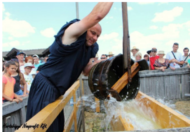
1. kép: A vízhúzás versenyszám egy pillanata

A vízhúzó versenyszám a Hortobágyi Állatpark kétgemű gémeskútjánál zajlik, amely esetében a rendelkezésre álló időkeret 2 perc. Minden, ez idő alatt megkezdett 10 liter vízért 2-2 pont jár, így a gulyások ezen az állomáson kb. 80-100 pontot tudnak szerezni.