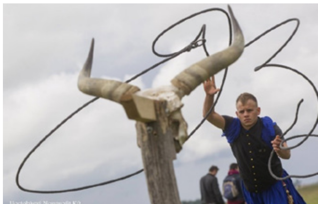
2. kép: A pányvadobás egy szürkemarha trófeára történik.