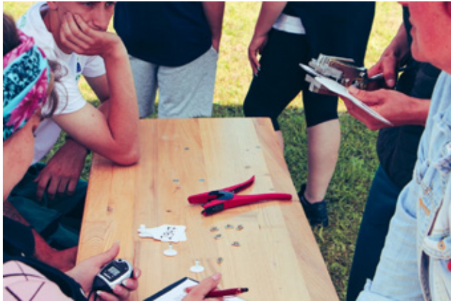
7. kép: Füljelzők és tetoválás behelyezése

A gulyások és bojtárok számára is megrendezésre kerül ez a versenyszám. Itt 1 perc áll rendelkezésre, hogy a versenyzők behelyezzék a füljelzőt, és elkészítsék a tetoválást a kihelyezett borjúfej alakra. A megszerezhető pontszám 50 pont, ám minden hibáért (számtevésztés, rossz pozíció) 10 pont levonás jár.