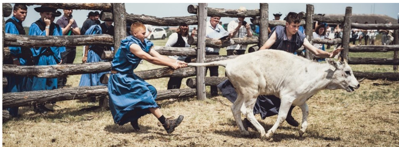
6. kép: A borjúfogás versenyszám egy pillanata