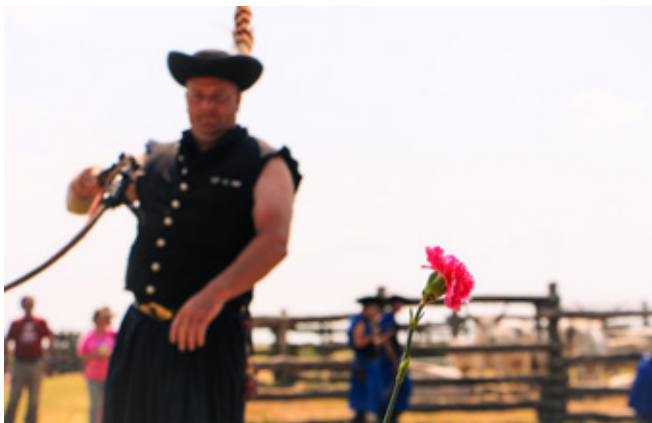
11. kép: A karikáshasználat pillanatképe