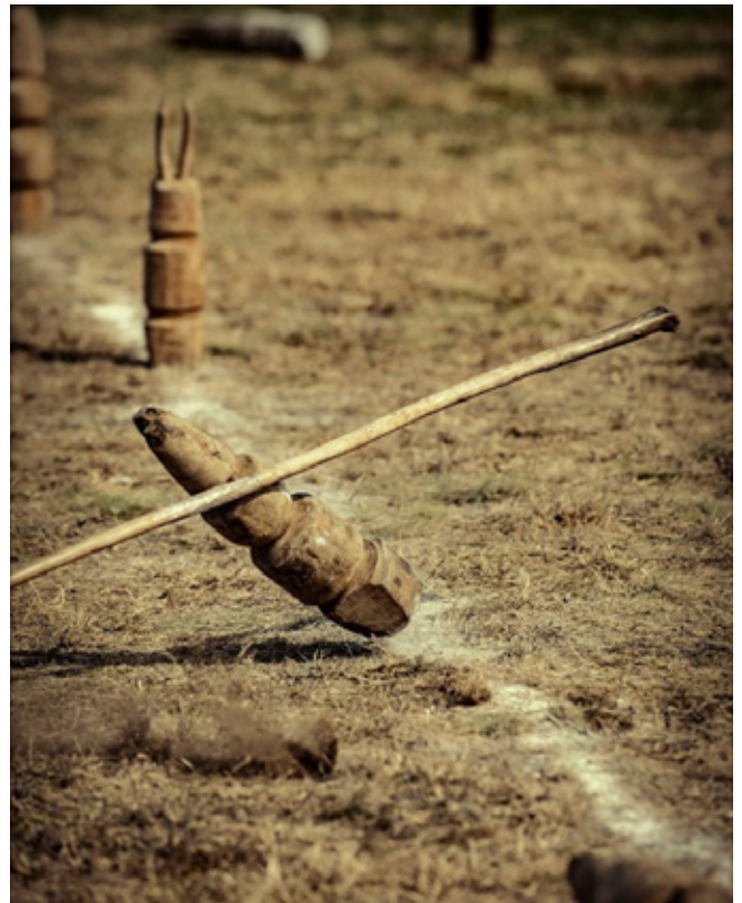
9. kép: Érvényes találat a nyúlütés versenyszámban.

Fontos, hogy a dobást az ősi módszerrel kell elvégezni, tehát csak az oldalról indított mozdulattal, a földdel párhuzamosan haladó (forgó) bottal elért találat számít.