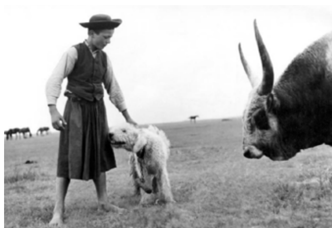
5. kép: Bojtár komondorral és kormos, ókulás bikával.

A felnőtt versenyszámokhoz hasonlóan itt is ki kell fogni a karámba zárt állatokat a szintidőn belül (7 perc), azonban elegendő a hat állatból hármat megfogni. Ennél a versenyszámnál borjakról van szó és kézzel történik a kifogás. A fülszámot is le kell olvasni. A pontozás is eltérő a felnőtt versenyszámhoz képest, ugyanis a kifogott állatok és helyesen leolvasott fülszámokért 15 pont jár. A rosszul leolvasott szám után 5 pont levonásával sújtják a versenyzőket. A leggyorsabb páros további 10 pontot kap, az azt követően végző csapatok 8-6-4-2-0 pontokat.