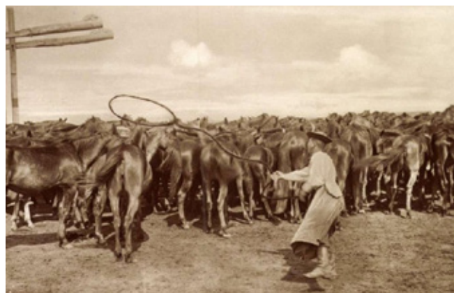
1. kép: A bot nélküli karikára szedett pányva használata egy csikós által.

mindegyike 10 pontot ér, így gulyásonként 50-50 pont gyűjthető.