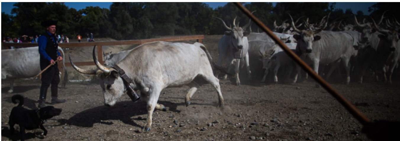
13. kép: A szürkemarhák áthajtása a hídon sinka juhászkutyával.

A felhasznált irodalmak a szerzőnél elérhetők.