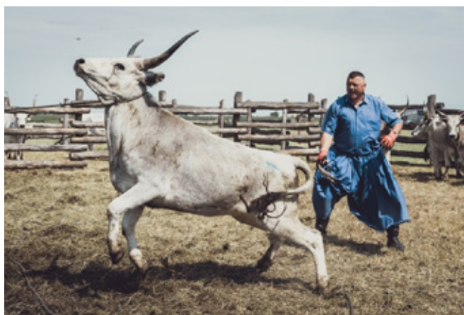
4. kép: A marhakifogás pillanatképe. Felkészülés a lekötéshez.