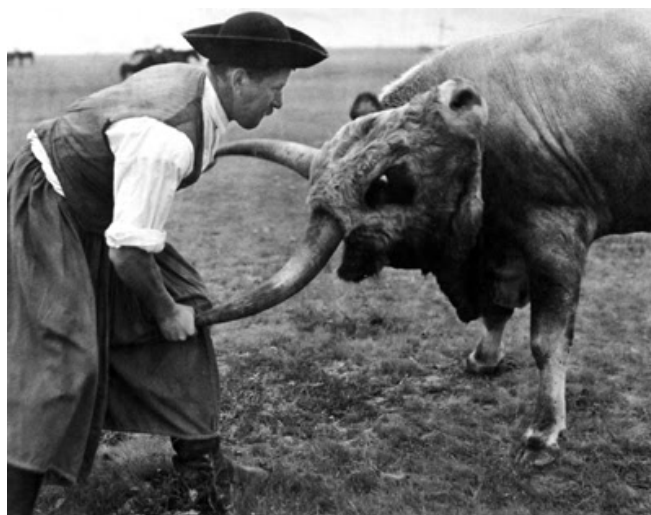
1. kép: Fiatal bika rendreutasítása.

A gulyások életében és munkájában, ami tulajdonképpen ugyanazt jelöli, sok kihívás volt és sokszor csak igen kemény emberek tudták űzni ezt a mesterséget. Ennek megfelelően a történelem folyamán a virtuskodás is fontos tényezővé vált a szakmán belül. Marhák lebirkózása, szarvánál fogva megállítása, rendreutasítása a pásztorok között az erő és bátorság egyfajta fokmérőjeként ivódott be a köztudatba.