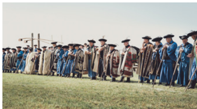
5. kép: A résztvevők hagyományos viselete akkor a legjobb és akkor éri el a legmagasabb pontszámot, ha az összhangban van a megjeleníteni kívánt mesterség szintjével és hűen tükrözi a tájegységre jellemző sajátosságokat. A szedett-vedett, oda nem illő elemek itt sem kívánatosak, akárcsak a korábbi korokat bemutató történelmi újraköltők köreiből.

vagy akár a különböző bajusztípusok. Egyébként a verseny részét képezi a viselet pontozása is.