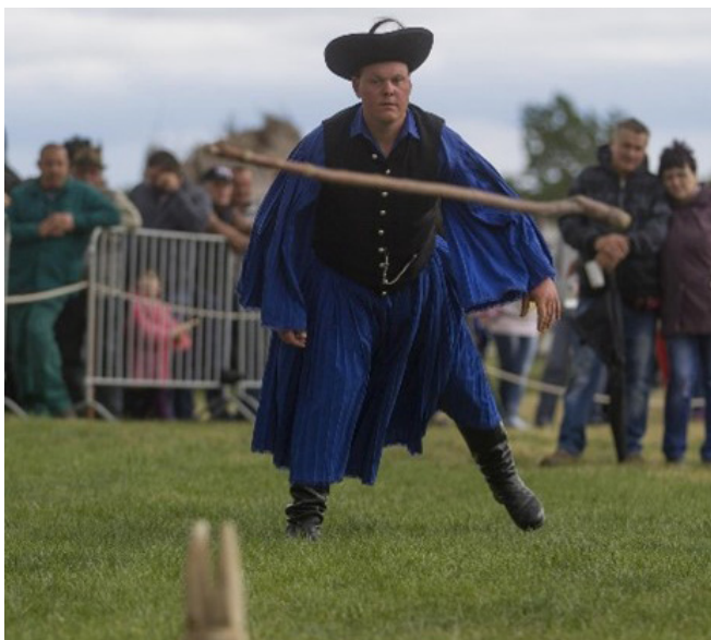
8. kép: Útjára indított gulyásbot

Ez a versenyszám a szinte már kultikus gulyásbot életveszélyes használatát hivatott bemutatni. A pásztorok a történelem során a vadászó ember által is használt hajtófázást a botjaikkal oldották meg. Ezzel élelmet is tudtak szerezni vagy akár a nem kívánatos ragadozókat is távol tarthatták, de tudunk olyan feljegyzésekről is, hogy a kanászok botja eleve azért legömbölyített végű, hogy az elhajított bottal a pásztor ne okozzon kárt az állatban, miközben így kényszeríti irányváltotásra a jószágot. A bunkós, kiszélesedő kialakítás, adott esetben ólommal (ónnal) történő súlyozása növelte ezen tárgy veszélyességét és hatásfokát.