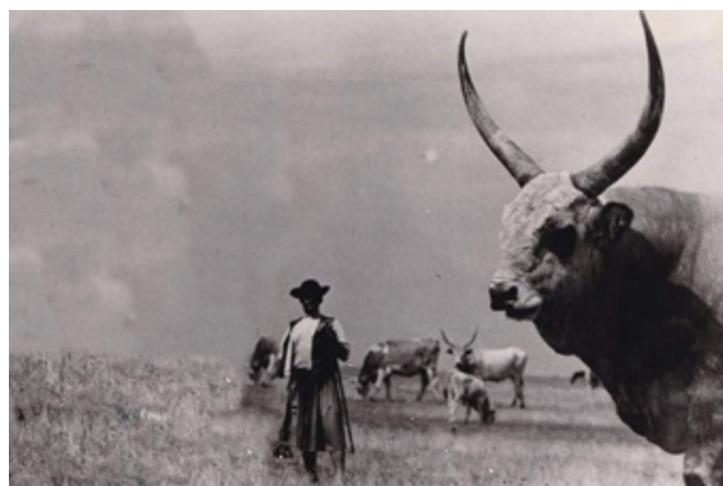
4. kép: Szöllösy Kálmán fotóművész fotója a Lucifer nevű szürkemarha bikáról és gulyásáról (Forrás: régi könyvek.hu)

évről évre hagyományosan pünkösd szombatján, Hortobágyon a Pusztai Állatparkban. A közel 30 éves múltira visszatekintő rendezvényre az ország minden pontjáról érkeznek a versenyzők és látogatók.