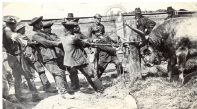
3. kép: egy szürke bika gombozáshoz (valószínűleg javítás) való kifogása.

Tulajdonképpen e mesterség ilyen fogásainak is állít emléket az Országos Gulyásverseny és Pásztortalálkozó, amelyet kezdetben Bösztörpusztán tartottak, majd a Hortobágyi Nonprofit Kft. szervezi