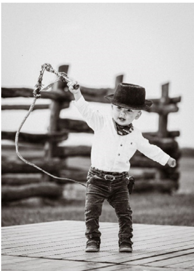
12. kép: Nem lehet elég korán kezdeni a karikás ostor használatát...