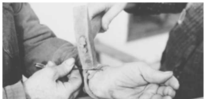
7. kép: Az érítés mozzanatának szemléltetése 1975-ben