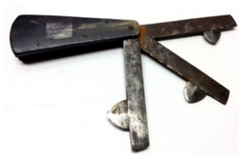
6. kép: Bicskához hasonlóan kialakított szaru nyelű érvágó