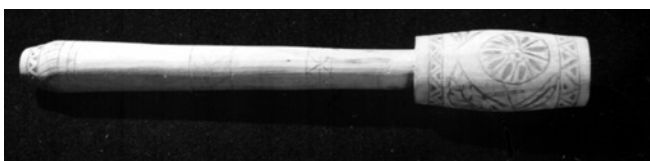
4. kép: Díszesen faragott érütőfa

végezték. A juhoknál főként a szemek alatti ereket vágták meg még a májmétely (motoszka) kezelésére is. Az egyszerű, egy darab acélból készült érvágók mellett a bicska módjára a nyélből kihajtható, többkések érvágók is elterjedtek voltak. Az érvágót az érre helyezve legtöbbször könnyű fakalapáccsal ütötték meg.