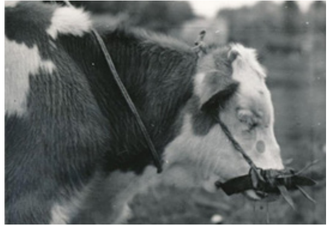
3. kép: Borjú tuskés palókéval

szúróka stb. Különböző változatai voltak, így megtalálható volt szögekkel kivert szopásgátló borjúkantár vagy deszka, a billenős palóka, a sündisznó bőrből készült palóka, a szúrós vaskeretből álló palóka vagy az egyszerű orrpecek.