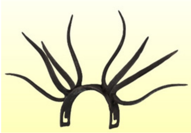
2. kép: Kovácsolt tuskés palóka

A saját tőgyüket kiszopó tehenekre és külterjes tartásban az anyjuktól (szopásról) leválasztandó fiatal egyedekre szopásgátlókat helyeztek. Ezek megnevezése palóka, orradzó vagy borjúkantár, tejjvédőkantár, szötyü, bökő,