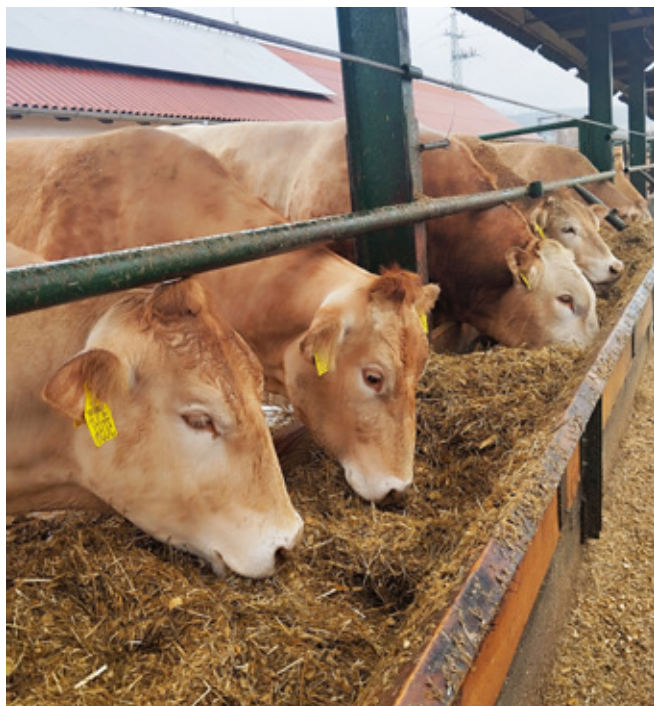
A tehének és a bika is elégedett az illatos, finom szilázssal!

A KE (fermentált gyógynövény-keverék) aktív összetevőinek azonosítására HPLC-MS-analízist végeztek, amely kulcsfontosságú vegyületeket mutatót ki: