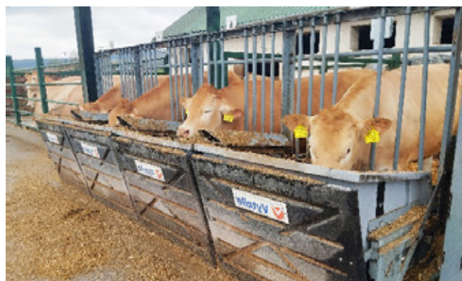
A taljándörögdi kísérlet körülményei (2025)

Az emberi kontaktus nélkül működő eszközök stresszmentesen gyűjtik az állatok legfontosabb teljesítményadatait, majd azokat automatikusan továbbítják feldolgozásra és más információkkal való integrálásra.