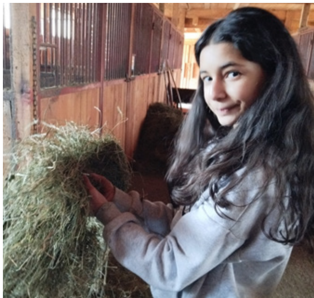
A kezelt réti széna jó hozamú és illatos!

minőségére, stabilitására, a szaporodásbiológiai és termelési eredményekre, valamint a gyulladási folyamatok gyakoriságára és lefolyására (SCC, masztitisz, metritis).