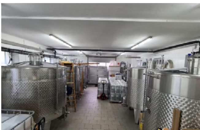
A fermentált gyógynövénykeverék Hollensteinben készül, Ausztria szívében https://www.ke-lab.com/

A bioaktív vegyületek (mint a kurkumin, kapszaicin és kvercetin) alkalmazása szabályozhatja a gyulladós útvonalakat , csökkentheti a citokintermelést, erősítheti a nyálkahártya védőrétegét, és elősegítheti a bélrendszer egészségét azáltal, hogy befolyásolja a bélmikrobióta összetételét és a baktériumflóra anyagcseretermékeit (Sureshbabu és mtsai, 2013; Chen és mtsai, 2022). Ezek a hatások javítják a tápanyagfelszívódást és az immunfunkciót, hozzájárulva az állatok jobb egészségi állapotához és ellenálló képességéhez.