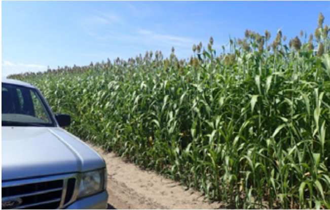
Látható tehát, hogy a korszerű cirokfélék nem csak a jó szárazságtűrés és a kedvező hozam miatt ígéretes nyári takarmányaink, de akár javító hatásúak is lehetnek a TMR-ben a rostemészthetőség szempontjából

csíraszám), valamint a betakarítás időpontjának helyes megválasztása. A hosszú távú kísérletekben a BMR (Brown Mid Rib) silócirkok emészthetősége 8%-kal kedvezőbb lett (a kisebb lignintartalom miatt), mint a normál, nem BMR silóciroké. Vannak már olyan tanulmányok, amik azt mutatják, hogy a BMR cirokszilázssal hasonló mennyiségű tej termelhető, mint kukoricaszilázssal (Aydin és mtsai, 1999; Oliver és mtsai, 2004; Dann és mtsai, 2007).