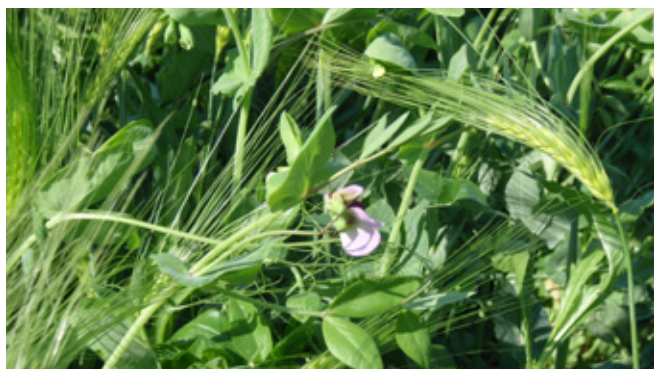
A kikalászolt árpás borsó 2013. május 15-én Hajdúböszörmény mellett

A 2013-ban, üzemi körülmények között elvégzett vizsgálat célja az volt, hogy meghatározzuk két takarmánykeverék terméseredményét és minőségét különböző fenológiai fázisokban történő betakarítás mellett. Ezekkel a vizsgálatokkal hiánypótló adatokat kívántunk biztosítani a gazdaságok és a növénytermesztési ágazat vezetői számára a döntés-előkészítéshez (hozam adatok, várható fehérje- és rosttartalom, szerves anyag emészthetőség a fenofázis függvényében). A Laverda árpa (Saaten Union) és Nany borsó keverék betakarításának optimális időpontja május 26. volt ebben a kísérletben (20-25 tonna szilázs/ha; 15% nyersfehérje; 25% nyersrost, 10% keményítő a szárazanyagban), mivel a hozam ezt követően már nem nőtt szignifikánsan, a táplálóanyag-tartalom pedig stagnált (Hajdúböszörmény térség, 450 mm csapadékkal 243 nap tenyészidőszak alatt, október 20-i vetéssel, 100 kg/ha vetőmag; 50:50 arányban). Az árpás borsó esetében a keményítő beépülésével párhuzamosan ment végbe a rosttartalom csökkenése május 20. és június 4. között. Május 26-án kezdtek el telítődni a szemek az árpában.