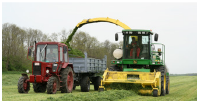
Gyönyörű olaszperje rendek felszedése 2008-ban!