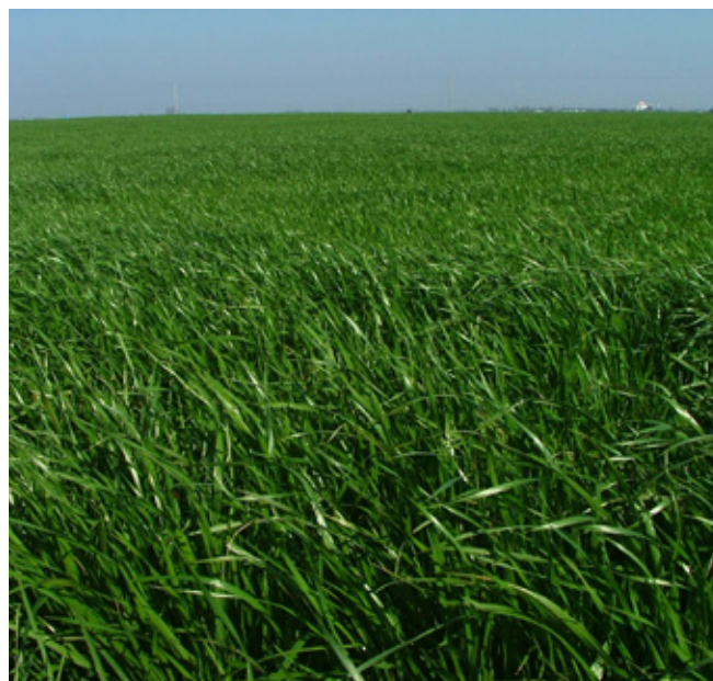
Olaszperje-állomány a Szikgát Tej Kft. területén (fotó: Kontró József, 2007. március)