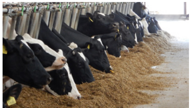
A tejtermelési szint emelkedése kihívást jelent a tömegtakarmány minősége szempontjából (fotó: Orosz, 2018; Csomád)

5. Új tömegtakarmány-stratégiák alakultak ki, aminek az alapja a diverzifikáció lett. A nyári hőstressz idején (kb. 3 hónap) a jól emészthető rostban gazdag szilázsok nagyobb mennyiségben szerepelnek a takarmányadagban, mint az őszi-téli-tavaszi adagokban. Ekkor ugyanis az étvágy általában normális, nem sújtja a meleg. Természetesen egész évben jótékony hatású lenne nagy mennyiségben roz- és tirtikálészilázst vagy olaszperjeszilázst etetni a kukorica- és a lucernaszilázs mellett, de ez a takarmányadag költségét emeli. Így mérsékelt roz-, tritikálé-, vagy olaszperjeszilázs adagot etetve 9 hónapon keresztül mérsékelhetőek a takarmányozási költségek. Annak mérlegelése, hogy a jó rostemészthetőségű szilázsoknak a nagyobb mennyiségben történő etetése milyen gazdasági előnnyel jár, és ez hogy viszonyul a többletköltséghez (tejtermelés, szaporodásbiológia, állategészség), a telepre van bízva, mivel a telep adottságaitól függ.