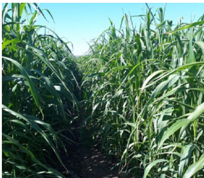
Szudánifű Peryépusztán

alkalommal különböző felhasználást tesz lehetővé (szilázs/szenázs, széna, zöld, legeltetve), alkalmazkodva az aktuális időjárási és termelési viszonyokhoz. A szudánifű sikeresen termesztető fő-, illetve másodvetésként is.