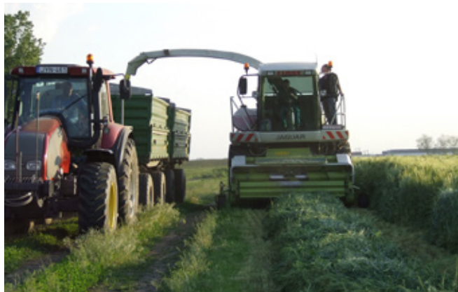
Árpás borsó betakarítása Berettyóújfalu mellett az AgroCow Kft. területén 2008-ban