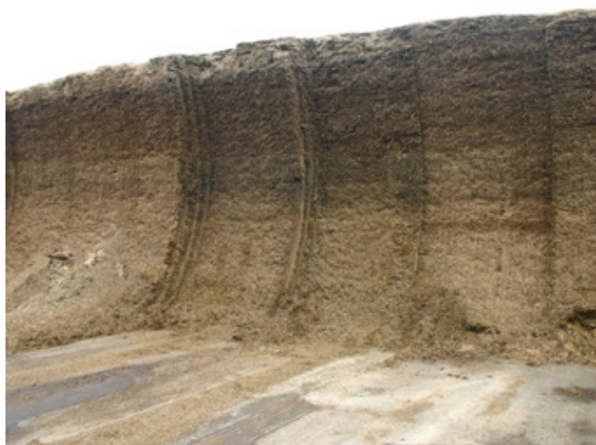
Nagy szárazanyag-tartalmú olaszperje-szenázs (174 g/kg szá. cukortartalommal és 143 mg/kg szá. karotin-tartalommal) a Nemesszalóki Mg Zrt. tehenészetében 2007-ben betakarítva

Kalászhányás előtt betakarítva a növényt (amikor a kalász még hasban van) mindössze 2-3% ADL-koncentráció jellemzi az új olaszperje fajtákat. Ekkor még nem álltak rendelkezésre korszerű rostemeszthetőségi értékek. A korai kísérletek során a fűszilázsok/szenázsok látszólagos nyersfehérje és nyersrost emészthetőségét vizsgáltuk in vivo ürükísérlettel meghatározva. Akkor még csak sejtettük, de ma már tudjuk, hogy az olaszperje-szilázsok 48 órás rostemeszthetősége kiváló, átlagosan 65% (2013-2020: 574 minta) és nem ritka a 80% feletti érték sem, miközben a lucernaszilázsok rostemeszthetősége átlagosan 40%, a kukoricaszilázsé pedig 50-55%. Ez a kulcs a kedvező étrendi hatáshoz.