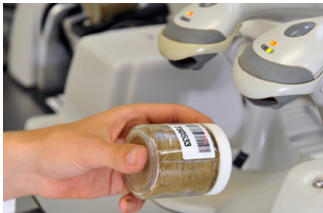
A labortechnika fejlődése hozzájárult az ágazat fejlődéséhez. NIR színekép beolvasása szárított darált mintából.

rostfrakció (NDF, ADF, ADL) csak külön kérésre készült el jelentős többletköltség mellett. Az emészthetőségre pedig csak következtethettünk a lignintartalomról, de mért adat nem volt rá. A Magyar Takarmánykódex pedig az emészthetőségi adatokat csak takarmánytípusokra adta meg, mely takarmánylista mára hiányossá vált. Tehát ha felmerült egy takarmányozási probléma, akkor sokat kellett várni a diagnózis felállításához. Lehet, meg is oldódott a baj addigra, vagy elfogyott a takarmány, mire az eredmény megérkezett. Ezért a nyugat-európai és az USA-beli laborok közül néhány érdekes fejlesztésbe kezdett 20-30 évvel ezelőtt.