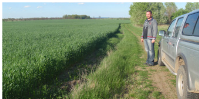
Az első rozstábla Magyarországon Csémpusztán, a Komáromi Mg. Zrt. területén