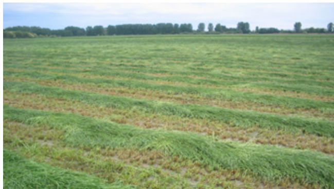
Ígéretes olaszperje rendek a Dávodi Augustus 20 Zrt. területén 2007-ben!

abrákra alapozott takarmányadag azonban számos anyagforgalmi problémát eredményezett a tehenelekben, amit akkor a nagy tejtermelés természetes velejárójának tekintettünk. Hibáztunk, lehet egészségesebben több tejet termelni!