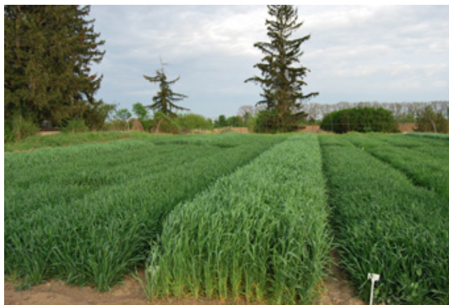
Az első rozsz és tritikálé kísérlet 2016. tavaszán Iregszemcsén a Kaposvári Egyetem Takarmánytermesztési Kutató Intézetében, a Kruppa Mag Kft., és az ÁT Kft. együttműködésével

A rozsszilázssal kapcsolatban azonban voltak kritikus vélemények is, amit nem szabad figyelmen kívül hagyni. Az egyik a rendkívül szűk betakarítási ablak (3-5 nap), az egyfunkciós jelleg (ha elkéstünk, lekéstük) és a kora tavaszi hűvös időjárás miatt vizesen (sokszor) földesen betakarított anyag vajsavas erjedése. Ezért olyan növény irányába fordultunk, melynek a betakarítási ablaka szélesebb, 7-10 nappal később érik és 'többfunkciós'. Ez volt a tritikálé 'nagy pillanata'.