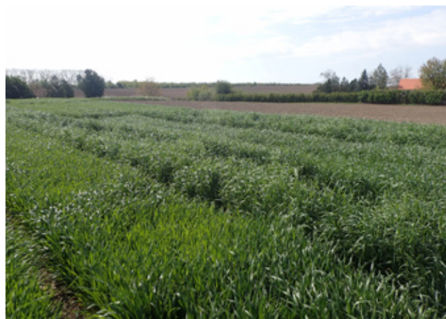
Rozs és tritikálé hozamának összehasonlítása mikroparcellás kísérletben Iregszemcsén, 2017. április 24-én

a rost bendőbeli lebonthatósága ilyen állapotban már gyenge (49% NDFd 48 -t mértünk mindkét esetben) és a lebontható rost is kevesebb (dNDF: 250-260 g/kg sza.). A szalmaszerű szár sajnos megsebesíti a káros hatását.