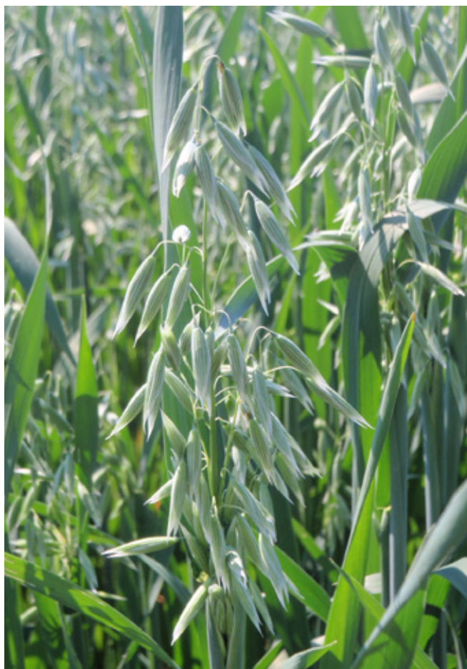
Virágzó zab tavaszi keverékben Fészerlakon 2013-ban, a Kaposvári Egyetem gondozásában

Egy másik, impozáns méretű kaposvári kísérlet (TÁMOP-4.2.2.A-11/1/KONV-2012-0039; P007 Kutatócsoport) célja annak feltárása volt, hogy az eltérő csíraszámok és csíraarányok hogyan hatnak a tavaszi és őszi vetésű zabos, árpás, búzás és rozsos keverékek táplálóanyag-tartalmára, emészthetőségére és táplálóértékére. Továbbá keresték a választ, hogy a táplálóanyag-tartalom alapján, a fiatalon betakarított gabona-borsó és gabona-bükköny keverékek milyen szerepet tölthetnek be a tejelő szarvasmarha takarmányozásában. A kísérlet során hat különböző csíraszámú vetett gabona-borsó és hat különböző csíraszámú vetett gabona-bükköny zöld keverék került összehasonlításra a táplálóanyag-tartalom, a szerves anyagok emészthetősége és a táplálóérték szempontjából. A kísérletet a Kaposvári Egyetem Tan- és Kísérleti üzemében állították be - Fészerlak pusztán -, 2013. őszén (vetés: szeptember 29-én, a kísérleti vágás 1-jén, 11-én és 19-én), valamint a tavaszi vetésűek esetében 2014. tavaszán (vetés: április 3., betakarítás június 28.). A több száz parcellás kísérlet monumentális méretű volt. Az eredmények bemutatására itt nincs lehetőség, de akit érdekelnek a részletek, dr. Hoffmann Richárd tanár úrnál érdeklődhetnek Kaposváron.