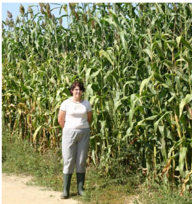
A silócirok hozama kapitális, de tápláléértéke miatt ma már nem való tejelő tehénnek (fotó: Orosz, 2005, Nemesszalók)

tömegtakarmány célú cirkok bugázása mindaddig ne induljon be, míg a nappali megvilágítás nem csökken 12,5 óra alá. Ezzel nagyobb 'betakarítási ablak' alkalmazására nyílik lehetőségünk, illetve minimalizálja a korai előregedés kockázatát, biztosítva így a sokáig kedvező rostemészthetőséget. A BMR (Brown Mid Rib) , mint tulajdonság (a levélerek és egyes növényi részek barnás-sárgásbarnás elszíneződése) ugyanúgy, mint a kukoricában, a cirokfélékben is (szemes- és silócirok, szudánifű) megtalálható. Az alacsonyabb lignintartalom, illetve gyengébb cellulóz-lignin kötés adott fenológiai fázisban kedvezőbb rostemészthetőséget eredményez. Tehát a lignintartalom nem csak fenofázis, hanem fajtafüggő is!