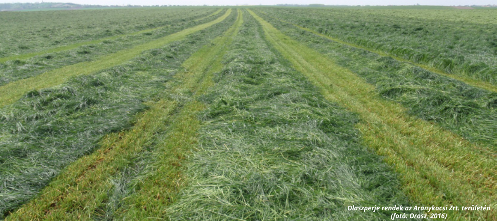
Olaszperje rendek az Aranykocsi Zrt. területén