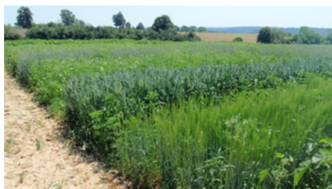
Tavaszi keverékek kisparcellás vizsgálata Fészerlakon 2013-ban, a Kaposvári Egyetem gondozásában

Tavaszi keverékek. Egy tavaszi keveréket vizsgáló szántóföldi kísérlet a Kaposvári Egyetem Tan- és Kísérleti üzemének Bemutató és Gyakorló kertjében került beállításra Fészerlak pusztán, 2013-ban. A kísérlet során három zabos borsó és három zabos bükköny keverék került összehasonlításra, egy időpontban betakarítva. A vetés időpontja 2013. március 28. volt. A betakarítás 2013. június 19-én történt (a zab szemérésekor a borsó virágozott). A zabos borsó és a zabos bükköny zöld keverékekről megállapítható volt, hogy a silókukorica hozamának megközelítően a 40-60%-át tudják teremni, nyersfehérje-tartalom tekintetében egy gyenge minőségű lucernaszilázsnak feleltethetőek meg, korlátozott energiatartalommal. Fiatalon betakarítva azonban mindkét keveréktípus (valamennyi csíraszám esetében) kiváló rostforrásnak bizonyult a bendőben lebomló NDF szempontjából a silókukorica-szilázshoz képest. A keverékek jelentős mértékben felülmúlták a lucernaszéna rostemészthetőségi paramétereit is! A kísérlet eredményei igazolták, hogy a tavaszi vetésű zabos keverékek lehetnek kedvező tulajdonságokkal rendelkező szilázs-alapanyagok.