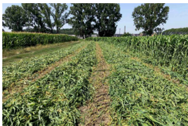
Szudánifű kétmenetes betakarítása 180 cm-es állománymagasság mellett (Dél-Alföld, 2019.)

Ezzel a gondolatsorral bezárom a takarmánynövény-termesztés történetének elmúlt 12-13 évét és általam fontosabbnak tartott történéseit, egyúttal visszatérek az etetőasztalhoz, azaz a tehénhez.