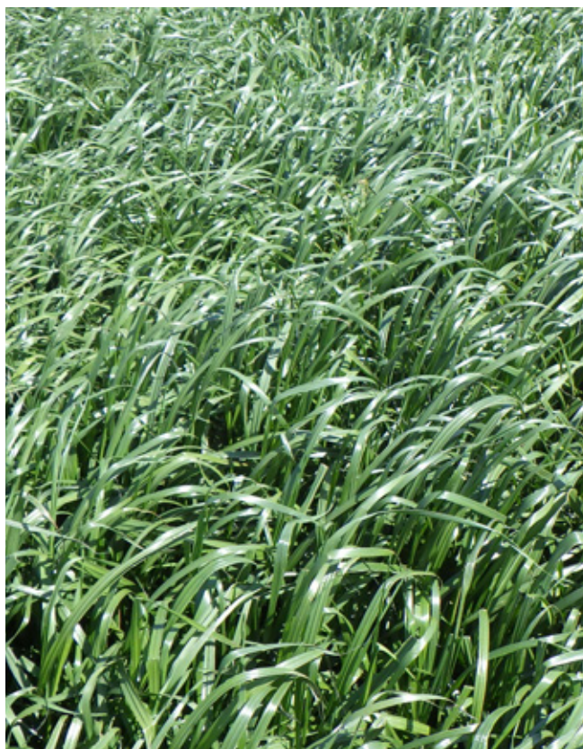
Jenny olaszperje Magyaralmáson