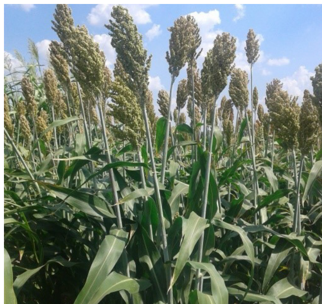
A (nem BMR) szemes cirok tápláléértéke kiváló, de rost-emészthetősége gyenge a szemérés fázisában

A megváltozott lignintartalom, illetve szerkezet viszont több olyan negatív agronómiai tulajdonságot is magával hozott (a legújabb kutatási eredmények szerint 10-12%-kal) alacsonyabb termés, gyengébb szárszilárdság-dőlésre hajlamos állomány, mely eddig limitálta ezen hibridek széles körű elterjedését. A gazdálkodók egy része azt tapasztalta, hogy a BMR cirok esetében a szár megdőlése nagyobb mértékű, mint a nem-BMR cirkoknál. Ezt kutatási körülmények között nem lehetett egyértelműen igazolni (Bean, 2006). A szárdőlést ugyanis számos tényező befolyásolja. Elsőként említjük a fajta/hibrid szerepét, de fontos szempont a nitrogén-utánpótlás mértéke (a túldozírozás egyértelműen hajlamosít a szárdőlésre), továbbá a kisebb vetési csíraszám csökkentheti a megdőlés veszélyét, végül pedig a betakarítás időpontja következik, mint szintén meghatározó tényező. A hímsterilitás (nincs nehéz buga a növényen) szintén segít a szárszilárdság megtartásában!