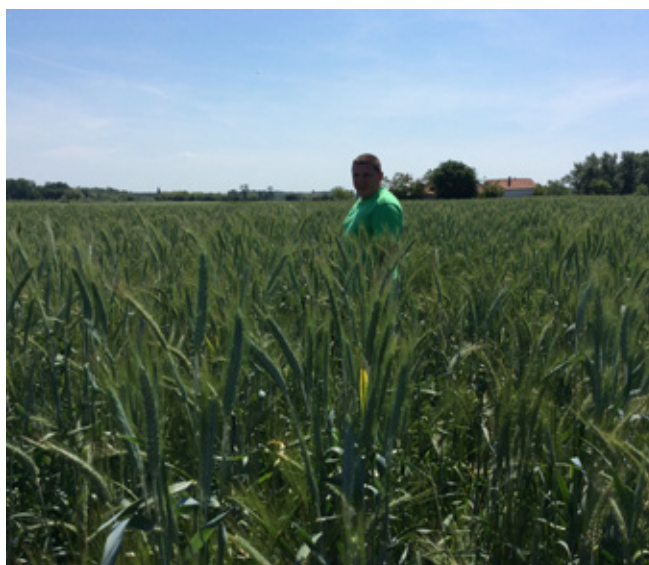
A Texas üzemi kipróbálása a DPMG Zrt. területén (Törtel, késő kalászoslásban: 2017. május 19.)