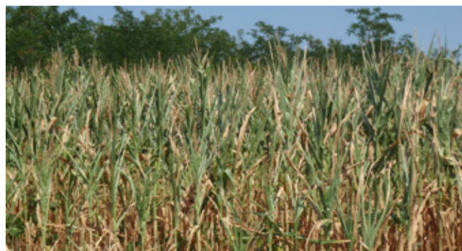
A hőstressz hatása a silókukoricára

A hőstressz sosem jön jókor, de a kukorica szemérése előtt érkező hóhullám katasztrófális hatással van a szilázsra nézve (mind mennyiségében, mind minőségében). Mivel a levelek elhalnak, elsárgulnak, és lelassul vagy le is áll a fotoszintézis, így a keményítő beépülése nem folytatódik. Tehát hiába várnánk a hóhullám elmúltával a kukoricaszemek telítődését, a növény már nem tud regenerálódni, ellenben az elhalt szöveteken megtelepednek a gombák. Ekkor több tehenészet azzal szembesült, hogy még spórolva sem lesz elég a kukoricaszilázs, nem marad 2008 nyarára. Mit