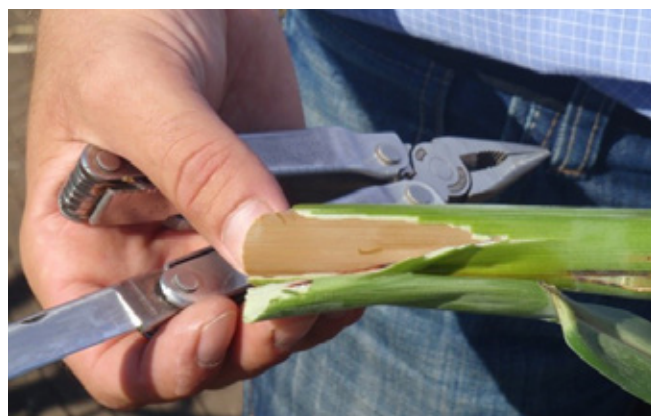
A BMR cirok jellemzője a barnás elszíneződés a levélen és a szár belsejében egyaránt

Miért érdemes ezen korszerű, de kisebb hozamú fajtákkal foglalkozni, ha nem ad nagyobb mennyiséget és gyengébb az energiatartalma, mint a silókukoricának? A mérsékelt hozam mellett megmaradt ugyanis a terméshibiztonság (szárazságtűrés). A cirok kb. 30%-kal olcsóbb és kb. 30%-kal kevesebb vizet igényel a kukoricához képest. Továbbá nem érzékeny az aflatoxinra, és javult a tápláléértéke (energiatartalma). Egyes BMR-típusú cirokfélék megközelítik a silókukorica energiatartalmát. De a korszerű cirokfélékben ma már nem a keményítő az elsődleges érték, hanem a jól emészthető rost!