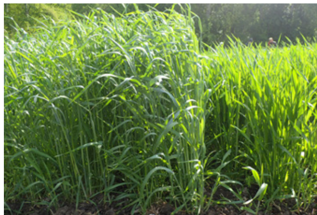
Rozsz (bal) és tritikálé (jobb) április közepén mikroparcellás kísérletben Szarvason 2017-ben a SZIE Tessedik Campus, a Kruppa Mag Kft. és az ÁT Kft. együttműködésével

eladható, vagy a tejelő tehén adagjába beépíthető gabonaféle. Az volt a kérdés, hogy ezen gabonaféle a korai betakarítás során versenyképes lehet-e hozamban és önköltségben a rozssal.